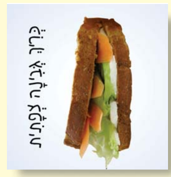
פְּרִיזֵר גְּבִינָה לְעֵתִית